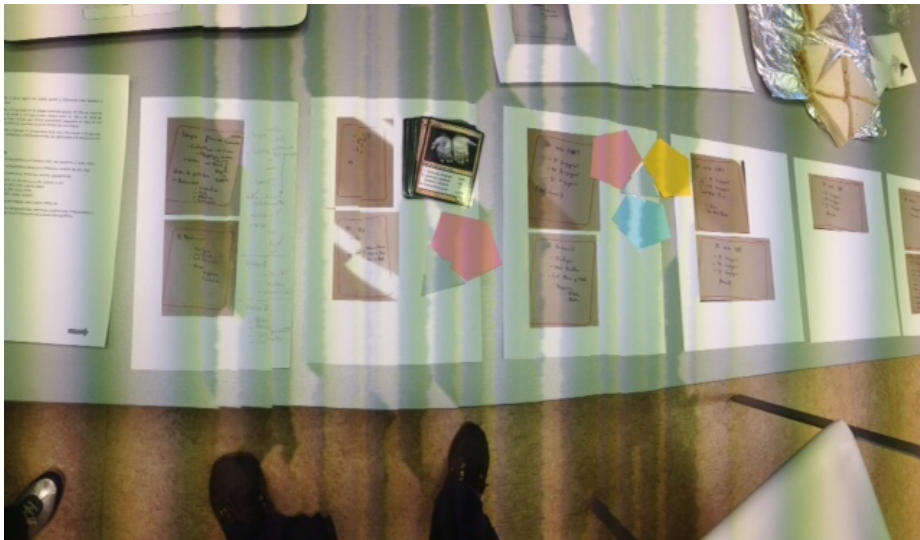
Figura 3. Actividad de diseño de los itinerarios didácticos e-learning de latín y alemán