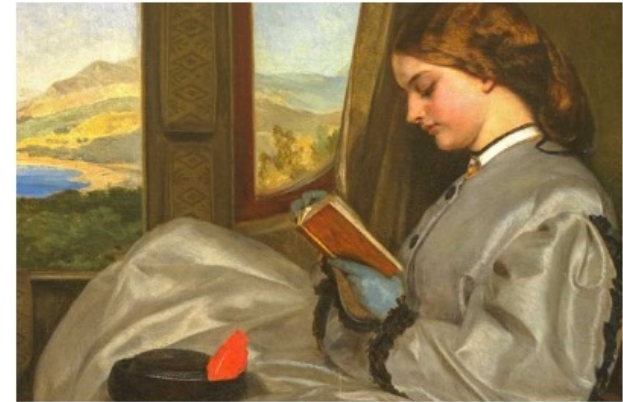
Editoras, Escritoras, Traductoras