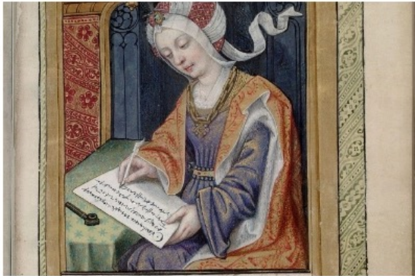
Recursos WEB y Bibliografía

La creación de un repositorio colaborativo de profesores y estudiantes sobre fuentes de información bibliográficas para la investigación en escritoras, editoras y traductoras españolas e hispanoamericanas no canónicas.